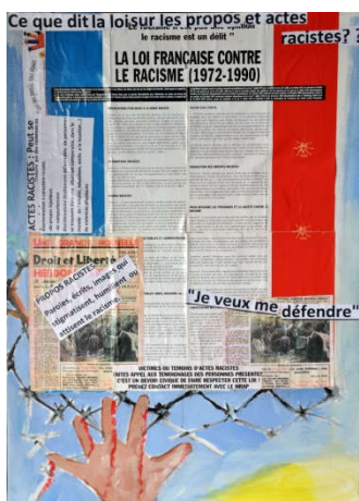
Tableau n°9 : la loi française contre le racisme.

La loi du 1 er juillet 1972, votée à l'unanimité du Parlement, s'inscrit dans les textes internationaux ratifiés par la France et trouve ses fondements dans l'article 1 er de la Constitution du 4 octobre 1958 : « La France est une République indivisible, laïque, démocratique et sociale. Elle assure l'égalité devant la loi de tous les citoyens sans distinction d'origine, de race ou de religion. Elle respecte toutes les croyances. »